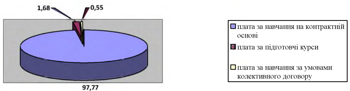
Рис. 1. Структура доходів НККЕП ім. С.В. Литвиненка від освітньої діяльності за 2018 рік, %

Структура доходів від основної діяльності за 2018 рік представлена на рис. 1.